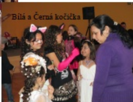
Bílá a Černá kočička